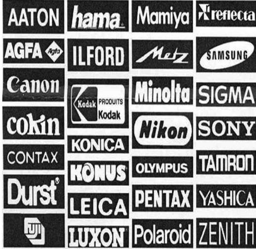
Photo - vidéo - numérique