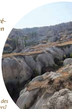
[La Vallée des Pigeonniers]

Depuis plusieurs mois et bien avant la pandémie, je prévoyais de partir avec des membres du Club Alpin Belge pour un merveilleux trek en Cappadoce. Prévu au départ pour le mois d'avril, il a dû être reporté aux congés de Toussaint 2020. Le choix de la destination ne s'est pas fait au hasard, j'ai eu l'occasion de me rendre à de multiples reprises en Cappadoce et je dois avouer qu'à chacun de mes séjours, la Cappadoce me paraissait davantage fascinante. Ne pouvant pas garder ces découvertes pour moi seule, les partager avec le CAB était une évidence!