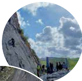
Sortie escalade à Landelies