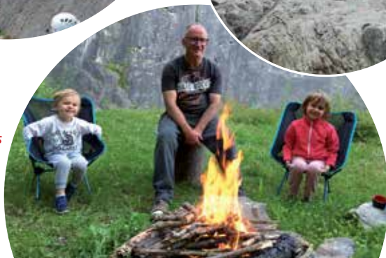
Bivouac à Landelies