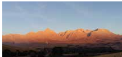
[Les Mont Pourpres]

Après 2h de route je suis arrivée à la petite auberge du village. J'ai été accueillie par Inna et son compagnon Oral, tous les deux très souriants et sympathiques, un charmant jeune couple. Je m'installe dans la chambre et admire déjà, de la petite terrasse, le magnifique panorama qu'offre Aladaglar qui signifie les montagnes pourpres. En effet, lors du coucher du soleil, les monts se parent d'une couleur rougeâtre voire violette.