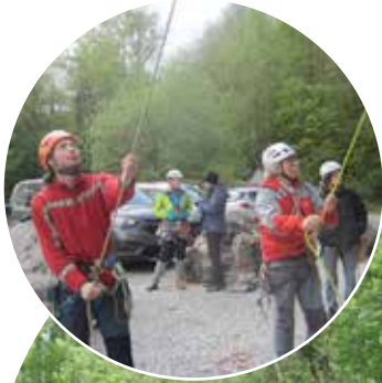
Stage de Printemps