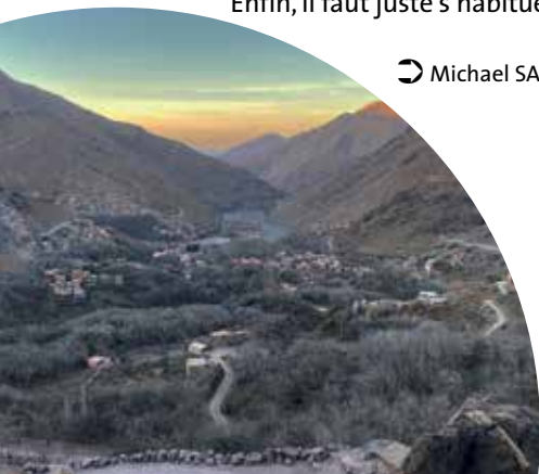
[Le village d'Armed]